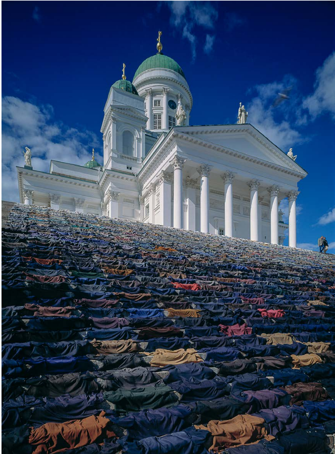
Way, Helsinki cathedral, 2000 - Copyright Kaarina Kaikkonen