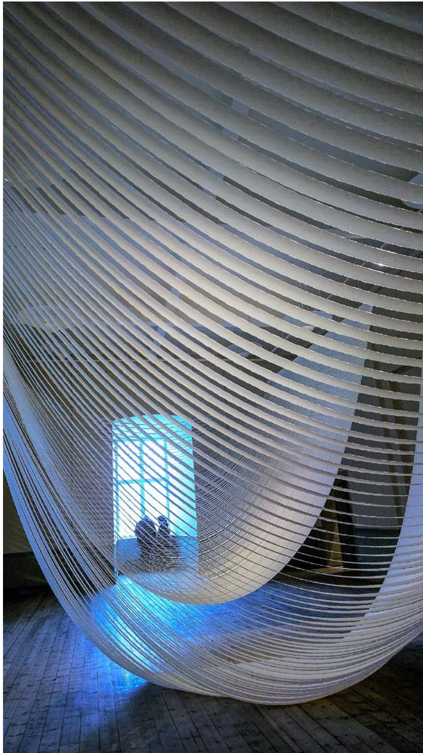
My Outline, Uppsala Art Museum, 2017 - Copyright Kaarina Kaikkonen

Photos d'installations précédentes par Kaarina Kaikkonen